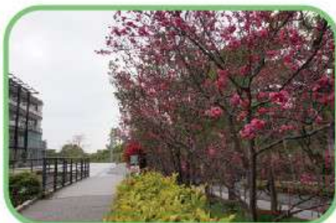
櫻花林(觀光餐旅大樓)