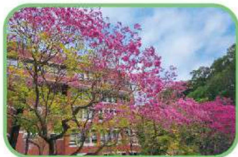
紅花風鈴木(管院來賓停車場)