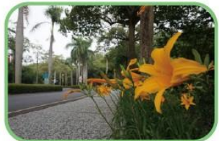
椰林大道(萱草-校花)