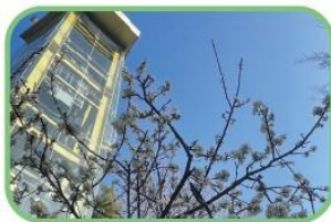
春日李花(外語景觀電梯)