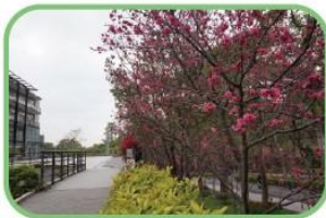
櫻花小徑(觀光餐旅大樓)